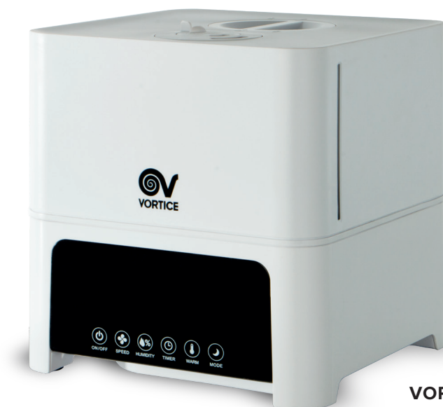
VORT HYDRO CUBE cod. 60405